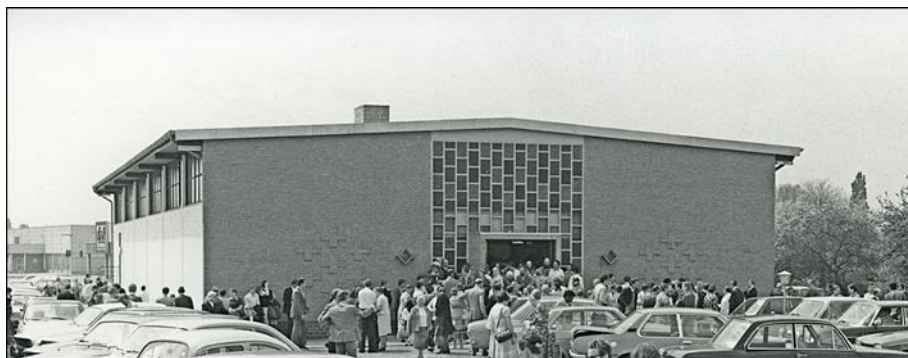
Inaugurarea clădirii bisericii noastre, în 1974