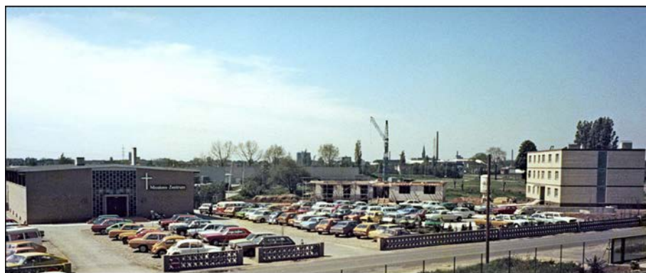
O fotografie a clădirilor misiunii în timpul construcției în 1977/78.