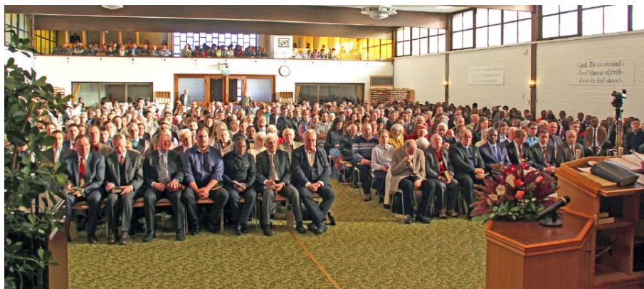
Adunarea de duminică, 4 decembrie 2016, în Centrul Misionar din Krefeld.

Iubite Doamne Isuse, Adu-Ți aminte de legământul încheiat cu noi De sângele vărsat pentru noi De făgăduințele pe care ni le-ai dat Și dăruiește-ne viața veșnică!